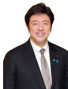
中山泰秀 防衛副大臣兼内閣府副大臣