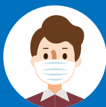
マスクの着用 Wear a face mask 佩戴口罩