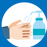
アルコール消毒 Disinfect hands 酒精消毒