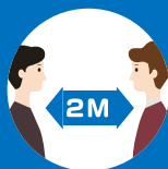
フィジカル・ディスタンシング Maintain about 2m of Physical distancing 社交場合保持2米距離