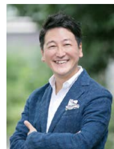
堀潤 ジャーナリスト